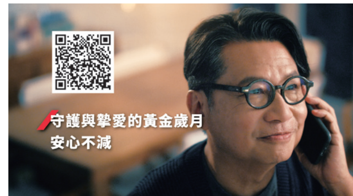
▲ 立即觀看「盛載人生」微電影，了解如何讓摯愛的退休生活盛載安心

根據《AXA安盛即享年金調查》*顯示，61%受訪者擔心長壽會耗盡自己的退休儲備，難以安享晚年。為此，「盛載人生即享年金計劃」（「盛載人生」）針對香港準備退休及已退休人士，提供即時且終身的每月保證年金收入，並設有終期紅利增加潛在回報。投保亦輕鬆簡易，客戶的整付保費總金額於300萬港元或以下，便毋須進行健康狀況核保。